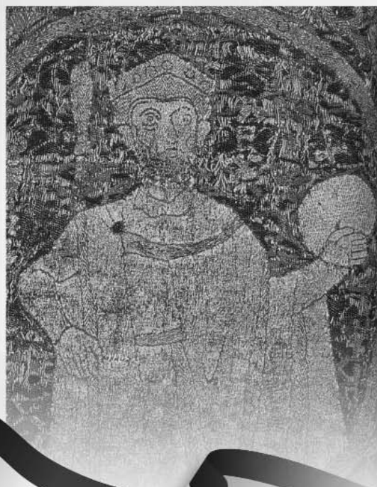
A koronázási palást egy részlete

Augusztus 16-án 19.00 órakor a Vigadóban: